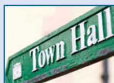
Bamirësi të specializuara

Nëse jeni i rritur (mbi 18 vjeç) do t'ju duhet të jepni aprovimin të referoheni në NRM. Duke aprovuar referimin në NRM, ju gjithashtu pranoni që informacioni juaj të shperndahet me autoritetet përkatëse, siç janë departamentet e Mistrisë së Brendshme dhe Policia. Ju nuk keni nevojë të raportoni në Polici, por ata mund t'ju kontaktojnë dhe t'ju pyesin nëse doni mbështetje për ta bërë këtë.